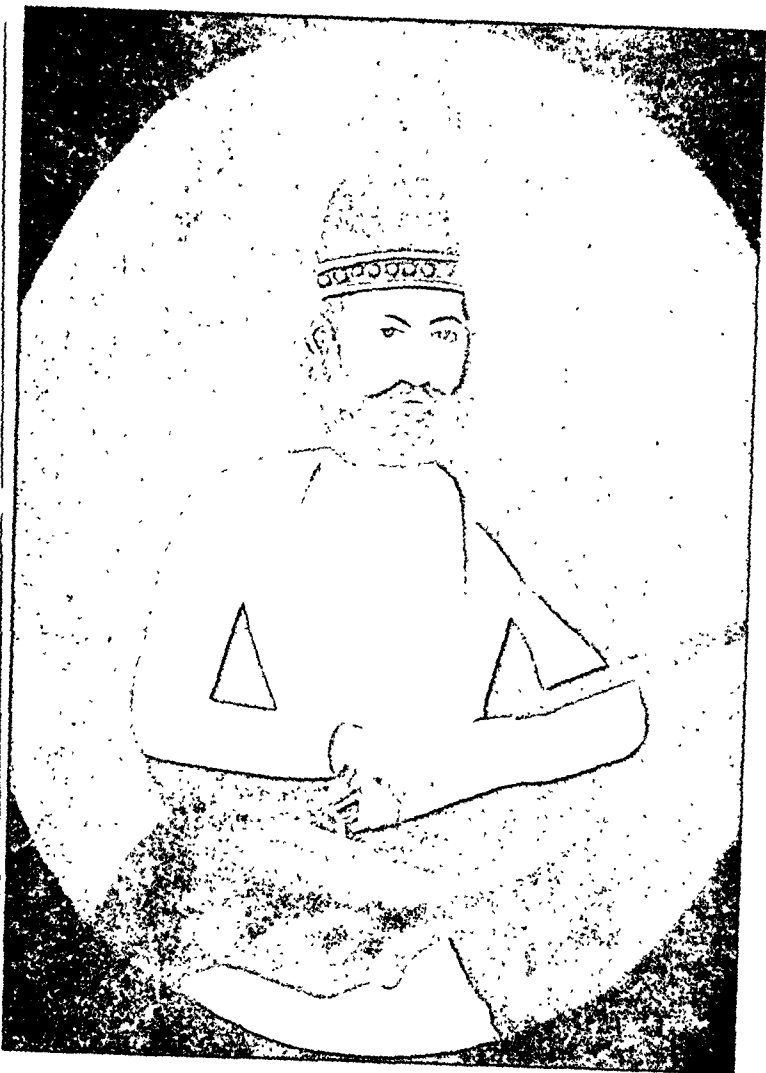
पण्डित गंगाधर नेहरू ( जवाहरलालजी के दादा )